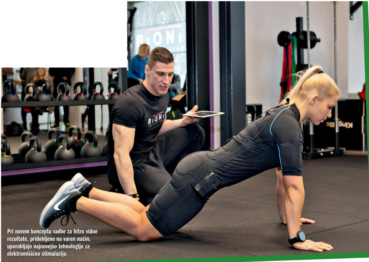
Pri novem konceptu vadbe za hitro vidne rezultate, pridobljene na varen način, uporabljajo najnovejšo tehnologijo za elektromišično stimulacijo.

cijo različnih poškodb, med treningom v novem studiu poskrbijo za še dodatno krčenje mišic. V 20 minutah lahko tako posameznik doseže učinek uro in pol trajajoče klasične vadbe in pri tem stimulira kar 90 odstotkov vseh mišic. Za udobno vadbo, za katero je priporočljivo, da se izvaja dvakrat na teden, v Bionic training studiu poskrbi posebej v ta namen zasnovana moderna, lahka in oprijeta funkcionalna obleka, imenovana powersuit. Ta omogoča brezžično uporabo tehnologije EMS in posledično enako svobodo gibanja, kot so jo posamezniki vajeni pri vadbi v svojih oblačilih.